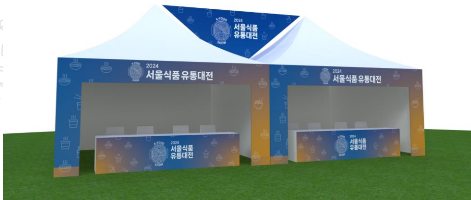
1. 목공부스 및 현수막 시안