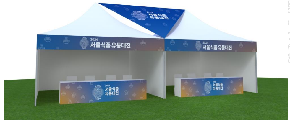
2. 기본부스 및 현수막 시안